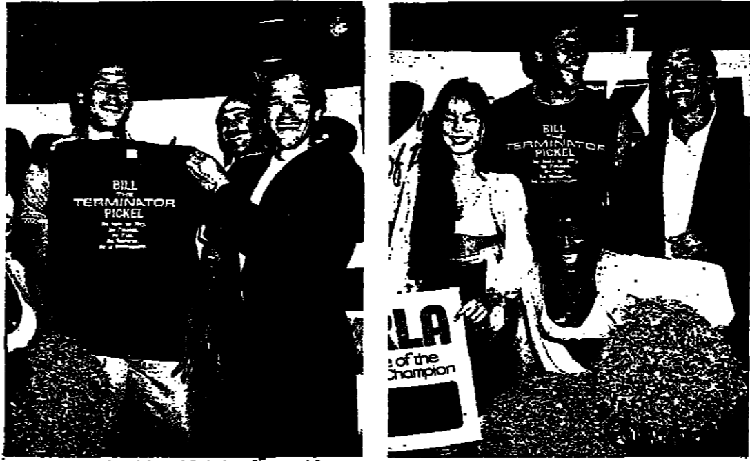
ترايير الضحك، لا يعيب، اسم الكاميرا

انه رجل العضلات في كل الايام التي يشارك فيها... اسمه في الحياة ارنولد شوارزنجورجر، وان كنت كل علة تحمل تحديا مفر بصحة، وان التدخين يسبب السرطان، وان السجائر تودد الهلكة، وان وان، ان ما لا نهاية. يقول الدكتور الخطيب دحان الارجيلة يتسبب في نوع من الامراض التي تصيب الرئة بالجفاف وتركم الازرقاق، بالإضافة الى النيكوتين والقطران على جدران القصبة الهوائية. ولكنه يقر ان الارجيلة اخف وطأة من السجائر. ويتحرك الداعون الى طلاق التدخين فينفعون بتدريس مخاطر التدخين، ضمن حملة تشارك فيها وزارات التعليم، لعلهم لا يعرضون القوم الضلال، ان كل ممنوع مرغوب، ولا يقرون سلفا ان التدخين قد يؤدي الى السرطان. كالتدخين بين التدخين، مثلا. قال علق الارجيلة، هؤلاء الاطباء، ستمسحهم الله، يقولون ان التدخين ضرر، وان الطعم المسمم اللذيذ ضرر، وان الراحة ضارة، لا واحد منهم ينكر في شيئا واحدا لا يضر.